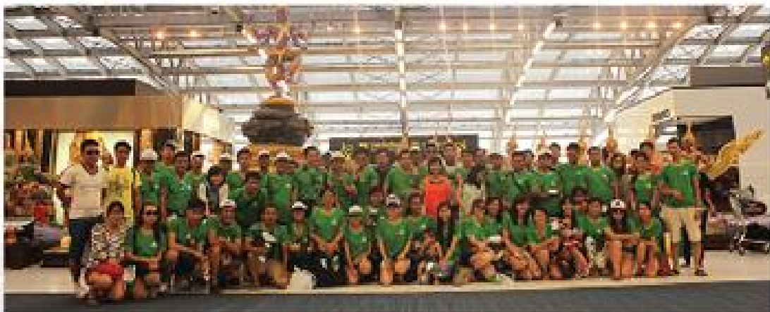
• Tập thể Thang Long Real chụp hình lưu niệm tại Sân bay Suvarnabhumi - Thái Lan

Ban Lãnh đạo Thang Long Real là những người trẻ, năng động, hiểu rõ tầm quan trọng của “con người” trong việc thực hiện các chiến lược kinh doanh cũng như là yếu tố rất quan trọng để xây dựng và phát triển doanh nghiệp. Chính vì vậy, Ban lãnh đạo Thang Long Real đã đặt mục tiêu chăm lo đời sống vật chất và tinh thần cho cán bộ nhân viên Công ty để họ có điều kiện phát huy tối đa tài năng trong quá trình hoạt động phát triển doanh nghiệp. Việc làm này sẽ góp phần rất lớn để Ban Lãnh đạo Thang Long Real có thể hoàn thành được mục tiêu và phương châm mà công ty đã đề ra: “Công bằng giữa Khách hàng – Cổ Đông – Nhân sự – Đối tác – Đối thủ”.