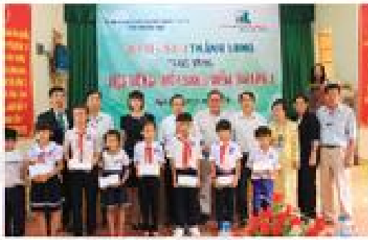
• Ban Giám đốc Thang Long Real và Đại diện Lãnh đạo Nhơn Trạch chụp ảnh lưu niệm cùng các em học sinh.