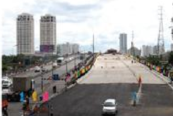
• Hình ảnh thực tế cầu Sài Gòn 2.

Sáng 12/9, công trình cầu Sài Gòn 2 đã hợp long nhịp cuối cùng sau 17 tháng thi công với sự lao động của gần 600 kỹ sư và công nhân. Dự kiến, ngày 2/11, cầu sẽ chính thức đưa vào sử dụng.